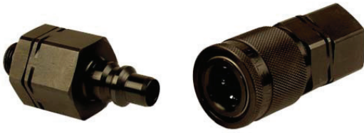
Hochdruck-Kupplungen der Serie HP High pressure couplings series HP