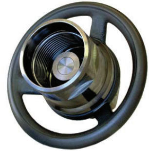
Schraubkupplungen der Serie CH Screw type couplings series CH